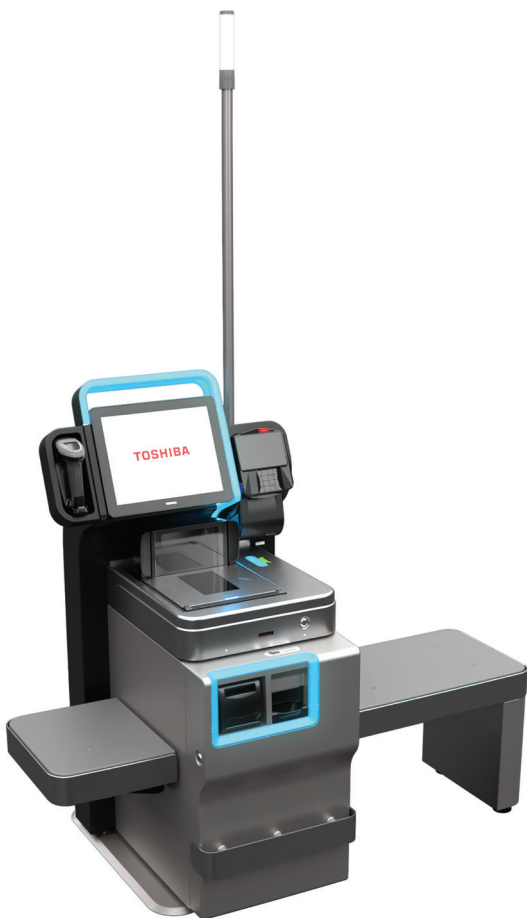
Конфигурация для оплаты наличными с функцией рециркуляции

Система Toshiba Self Checkout System 7 оптимизирует процедуру совершения покупок благодаря усовершенствованным звуковым оповещениям, а также возможности смены языка интерфейса. Кроме того, интуитивно понятные иконки и графические элементы экрана упрощают процесс оплаты, а световые подсказки помогают пользователю ориентироваться и быстро переключаться между отдельными точками взаимодействия с SCO, на разных этапах покупки. Также в устройстве предусмотрена возможность использовать сумку, которую покупатель принес с собой.