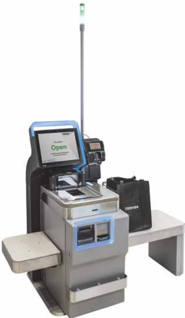
Конфигурация для оплаты наличными с функцией рециркуляции

Система Toshiba Self Checkout System 7 оптимизирует процедуру совершения покупок благодаря усовершенствованным звуковым оповещениям, а также возможности смены языка интерфейса. Кроме того, интуитивно понятные иконки и графические элементы экрана упрощают процесс оплаты, а световые подсказки помогают пользователю ориентироваться и быстро переключаться между отдельными точками взаимодействия с SCO, на разных этапах покупки. Также в устройстве предусмотрена возможность использовать сумку, которую покупатель принес с собой.