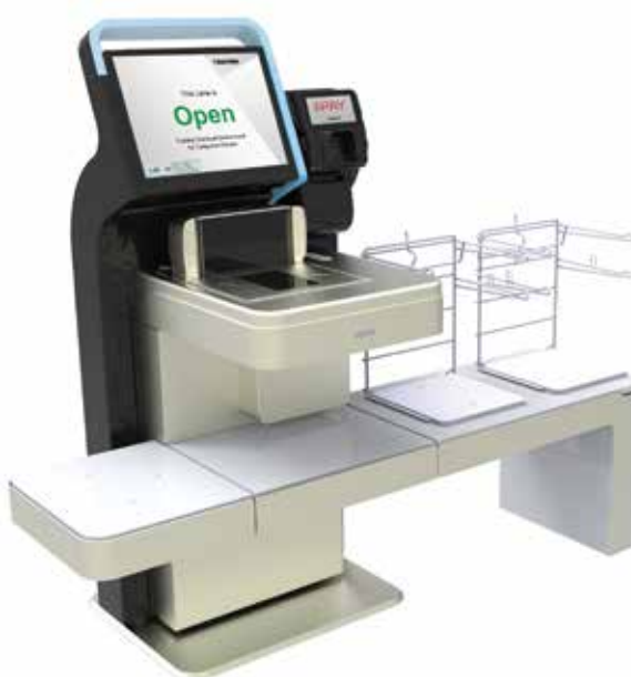
Конфигурация для безналичной оплаты